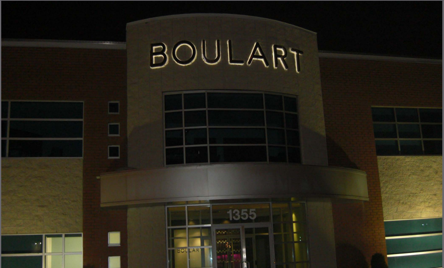
Photo de Boulart de l'extérieur